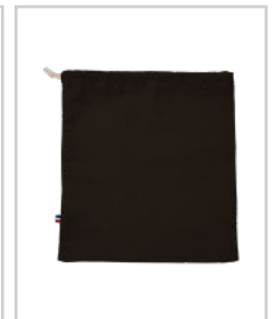
LÉON LE COSTAUD