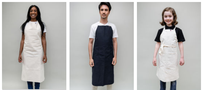
MICHEL SANS POCHE