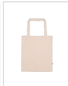
LÉON LE COSTAUD