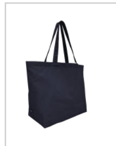
LE GRAND LEON